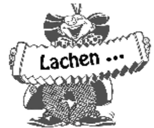
... ist die Musik der Seele!

16.-18.00 E Bücherei 16.30 E Rosenkranz 19.00 MK Pfarrgottesdienst